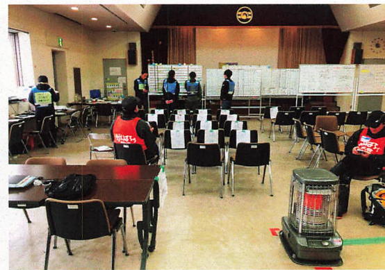
七尾市ボランティアセンター内部