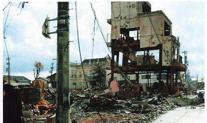
輪島朝市の火災跡

○ 今回派遣されて感じたのは、これまで行ってきた研修内容とは、全く違ったことが日々行われており、戸惑いが多かったことです。