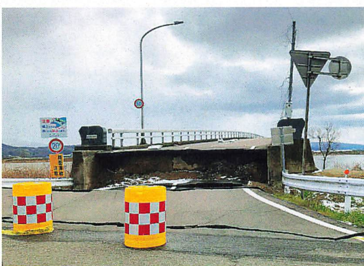
内灘町 橋桁が隆起して通行できない橋

液化化による被害が、甚大であると報道された内灘町。地面の隆起や沈下により、家屋や電柱は傾き、道路はうねったり傾斜していました。2か所の民家では、軽トラックを使用して機材の搬出をしていましたが、ボランティアの姿はなく、復旧作業は、まだ開始されていない様子でした。