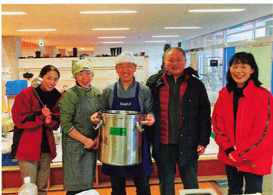
ご飯は水の使用が少ない無洗米が大助かり

3月以降、炊き出しの提供はかなり減ってきているそうです。一方で避難所の状況はあまり改善されておらず、「ぜひまた来てほしい」との要望もあり、3月24日（日）、再び行ってきます。被災地からのニーズは刻々と変化しています。その都度、現地の声に耳を傾けつつ、今の私たちにできる支援のあり方を、ここからも模索していきたいと思っています。