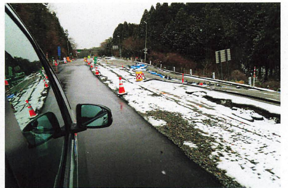
のと里山海道は片側通行

輪島へ向かう「のと里山海道」は2車線の道路が崖崩れで崩落し、元の道路左側に仮道を作って通れるようにして