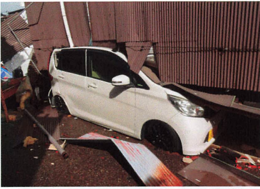
押しつぶされた自動車

避難所開設時には、喉の痛み、目の乾燥などを訴える人も多かったようですが、空気清浄機などを設置することで、訴えは減ったと聞きました。また、加湿器がある避難所とない所では、かなり差があったということです。