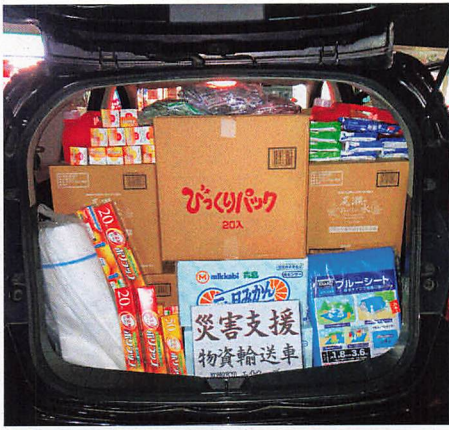
支援物資を自動車に満載して

「少しでも」お役に立ちたいと、毎日変わり続ける情報を、能登にいる親族、知人やSNSから集め、今、必要な物を調べ、前日との違いから先をも予測し、物資を厳選して箱にまとめ、大雪の中を東京から現地まで支援物資輸送車で届けることができました。