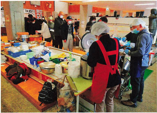
厨房は校舎の玄関内です

こうした中、知人が所属する海外青年協力隊OB会で、避難所からの要望を受け、定期的に日帰り、少人数による炊き出し活動を行っていることを聞きました。そこで「人手が足りない時、会員ではないが、助っ人として参加できないか」と尋ねたところ、快く受け入