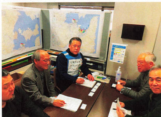
七尾市ボランティアセンターの方と打ち合わせ