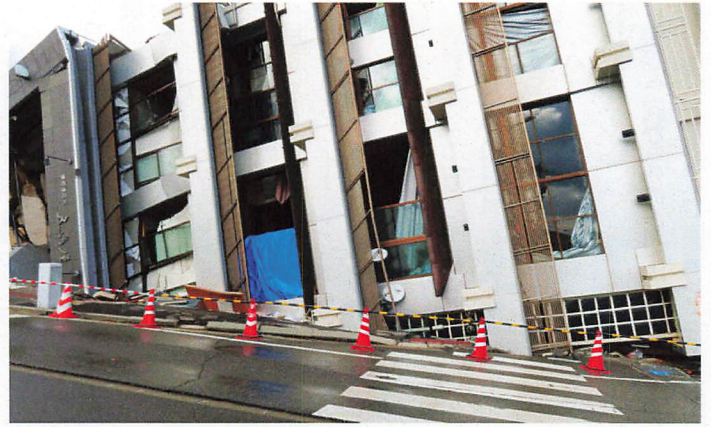
横倒しになったビル

これだけ大きな震災になると、被災した県の職員も被災しており、なかなかDWA等々の活動ができません。他県のDWAメンバーがメインで動くことになり、地理的理解にも難しさがあると思いました。