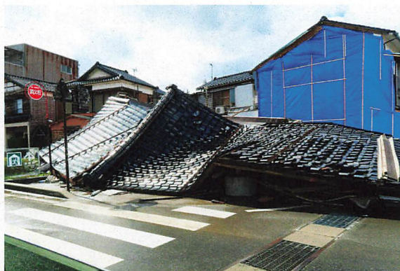
輪島郊外の住宅被害

いる箇所が数多くありました。輪島市内中心部では、朝市の周辺は火災跡地のままで、住宅も傾いて道路にはみ出したり、隣家に寄り掛かったり、倒れたままの状態がほとんどで、2か月以上経ってもほとんど手がついていない印象を受けました。