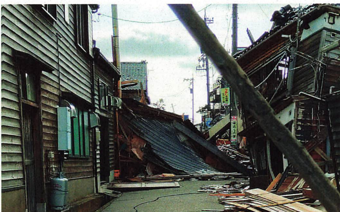
倒壊した家屋が道路を塞ぐ