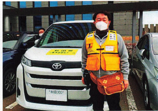
秋田県DWATとして石川県に入る

私はDWAT本部にて、各避難所のチームとの連絡調整、チーム間の調整、輪島市での拠点探し、状況把握などの