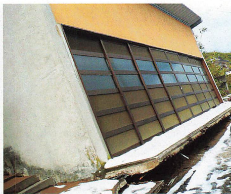
内灘町 液状化でうねった道路と傾いた建物