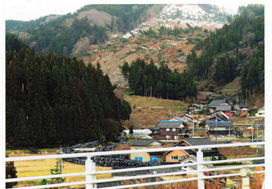
のと里山海道沿いの崖崩れ

いる箇所が数多くありました。輪島市内中心部では、朝市の周辺は火災跡地のままで、住宅も傾いて道路にはみ出したり、隣家に寄り掛かったり、倒れたままの状態がほとんどで、2か月以上経ってもほとんど手がついていない印象を受けました。